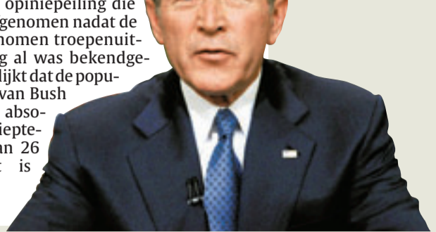
President Bush, nog nooit zo onpopulair.

gen Irakcommissie, maar die hij vooralsnog zelf niet wil zetten. Verwacht werd gisteravond zelfs dat hij Syrië nog eens als onruststoker in de regio zou brandmerken. Uit een opiniepeiling die werd afgenomen nadat de overgenomen troepenuitbreiding al was bekendgeraakt, blijkt dat de populariteit van Bush op een absoluut dieptepunt van 26 procent is beland. (GVV)