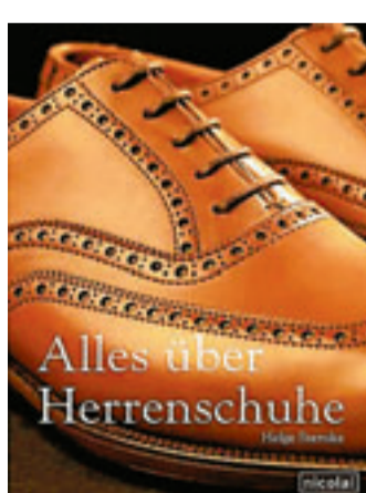
De cover van 'Alles über herenschoenen'.

«Mannen zijn niet enkel het slachtoffer van hun aangeboren modebewustzijn, maar ook van bevallige assistentes in de schoenwinkel», beweert auteur Helge Sternke (46). «Negen op tien schoenverkopers hebben u niets anders bij te brengen dan pure onzin. En daar trappen we allemaal in. Tot u spreekt een slachtoffer met ervaring. Honderden euro's heb ik weggegooid aan slechte schoenen.» Het dient gezegd, een man schiet pas wakker wanneer ze in zijn portefeuille zitten. Sternke verdiepte zich de afgelopen jaren in alle mogelijke lectuur over schoenen, bestudeerde productieprocessen en zocht raad bij modepauzen over de hele wereld. «Resultaat: een uitliem handboek dat mannen in staat stelt stellen zelf de juiste herenschoenen te kiezen die het beste bij hen passen.» Sternke geeft u tijdens de koopperiode graag al enkele waardevolle tips. (JF)