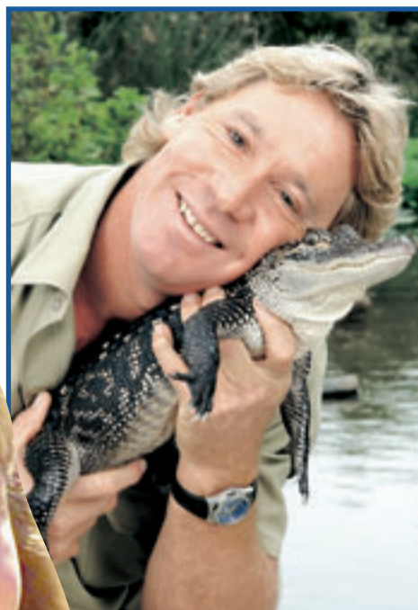
Steve 'Crocodile Hunter' Irwin met een van zijn troetels.

BEERWAH — Vier maanden na het dramatische einde van 'Crocodile Hunter' Steve Irwin treedt dochter Bindi in de sporen van de Australische documentairemaker en dierenfanaat. Het 8-jarige kind start vandaag aan een indrukwekkende tournee door de Verenigde Staten om haar eigen televisieshow 'Bindi, the Jungle Girl' te promoten. «Ik wil niet dat er een einde komt aan papa's passie», verklaarde ze vlak na de dood van haar vader al in een opgemerkte herdenkingsspraak. Maar tot ver buiten Australië laait kritiek op - omdat Bindi's familie vooral op geld uit zou zijn en het meisje rouw- noch kindertijd gunt.